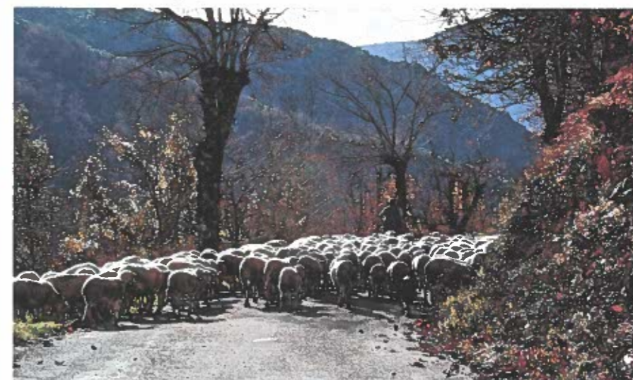
Troupeau de moutons dans les Cévennes.

le bruit des camions, de la circulation et des villes durant des journées. La sensation d'un voyage exotique, loin des zones commerciales, des franchises et des cités pavillonnaires dupliquées à l'infini. Dans chaque contrée traversée, l'architecture est fille du terroir.