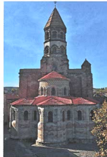
La basilique Saint-Julien de Brioude.

et de grands souvenirs. Des instants magiques, des rencontres chaleureuses et les richesses naturelles, historiques et culturelles sont gravées sur mes rétines. Sur tout le parcours, j'ai tout d'abord apprécié le petit ou grand patrimoine. Le champ de bataille de Verdun, les monts celtes et gaulois, les abbayes, les églises romanes, les hauts lieux de la Résistance et des guerres de religion, les chemins de Stevenson et de Compostelle ou les forteresses cathares. Les lavognes dans le Larzac, signes que les hommes ont aménagé au fil des siècles des milieux hostiles pour s'y installer. A contrario, les nombreuses cultures en terrasse, abandonnées depuis l'après-guerre, qui avaient su rendre nourricières ces terres pentues. Et que dire de Thines, dans la montagne ardéchoise, encore endormi malgré le fracas du torrent en contre-bas ? De ce voyage, je retiens aussi le calme et la quiétude des routes en oubliant