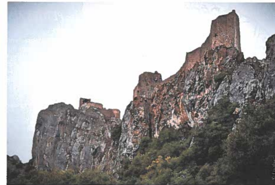
La forteresse cathare de Peyrepertuse.